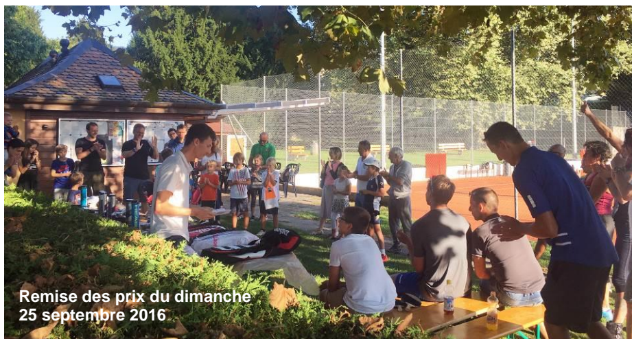
Remise des prix du dimanche 25 septembre 2016