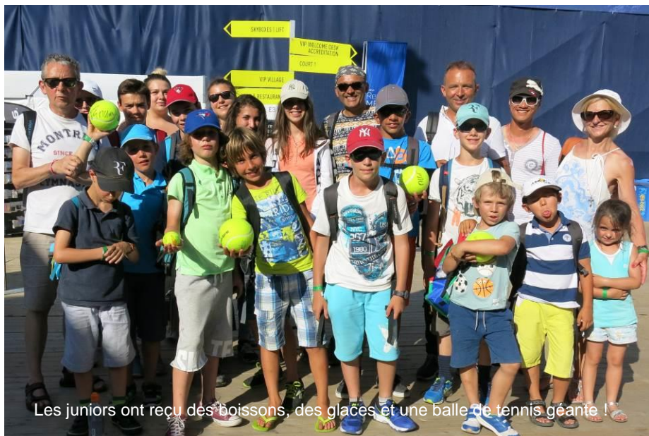
Les juniors ont reçu des boissons, des glaces et une balle de tennis géante !

Les bénéfices dégagés ces dernières années permettent le financement d'un tel événement. Celui-ci a été présenté lors de l'AG 2016 et semble avoir fait de nombreux heureux. A voir le nombre de casquettes et chapeaux, ça a cogné dur sur la montagne !